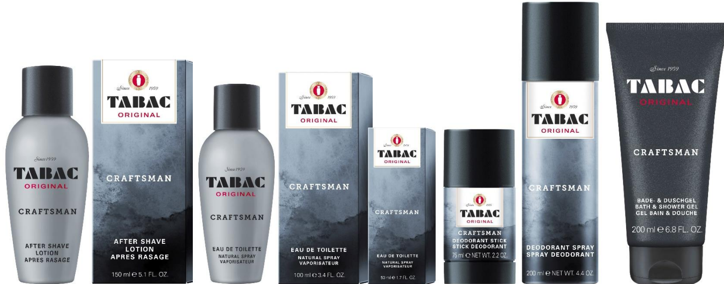
After Shave Lotion 150 ml